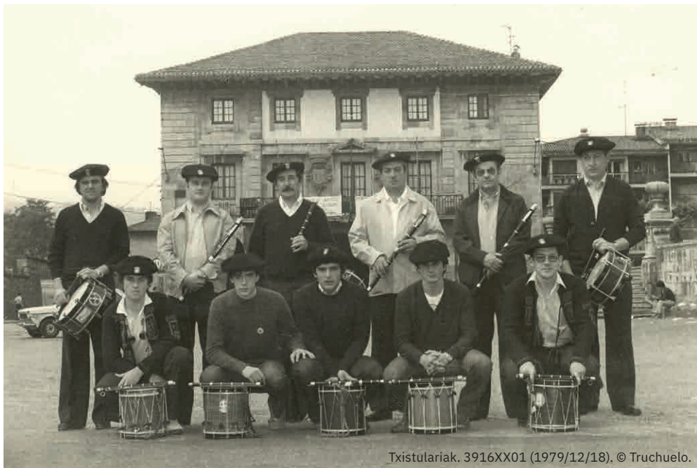
Txistulariak. 3916XX01 (1979/12/18), © Truchuelo.