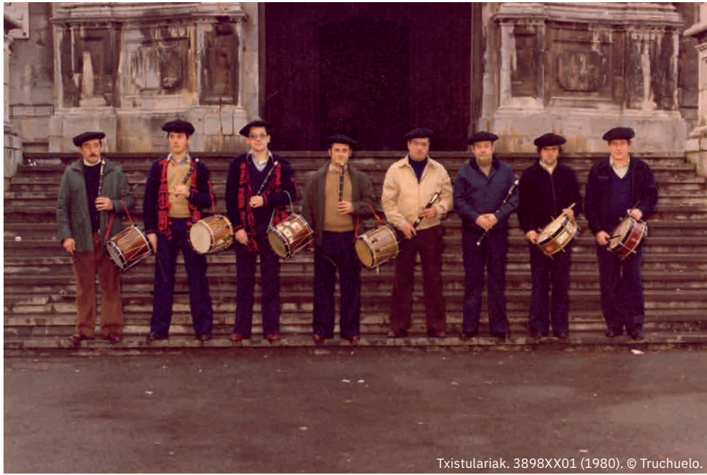
Txistulariak. 3898XX01 (1980).